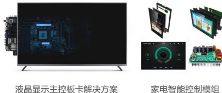
图1：部件业务主要产品

在液晶显示主控板卡领域，公司基于Mstar、MTK、Realtek、Amlogic、RDA、海思等主流芯片平台，推出了可支持全球主流电视信号标准的液晶电视主控板卡产品体系。公司还通过产品功能的整合（例如二合一板卡、三合一板卡、四合一板卡、五合一、六合一板卡、智能电视板卡等），帮助客户降低供应链成本，提高客户产线效率，提高产品竞争力，同时也提高了产品的附加值。