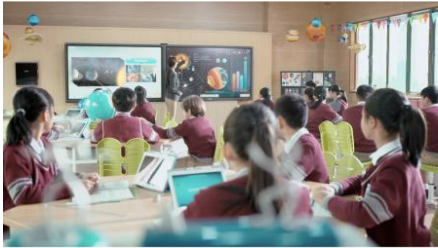
图2：希沃教学应用场景

区分学段和线上线下，多维度构建完整的教育信息化应用场景。以硬件设备为基础，完善教学软件体系，打通了教学环节的模块，对教学小数据进行无缝采集，最后通过呈现、分析小数据，辅助教学管理决策，助力教学优化，帮助教师发展。