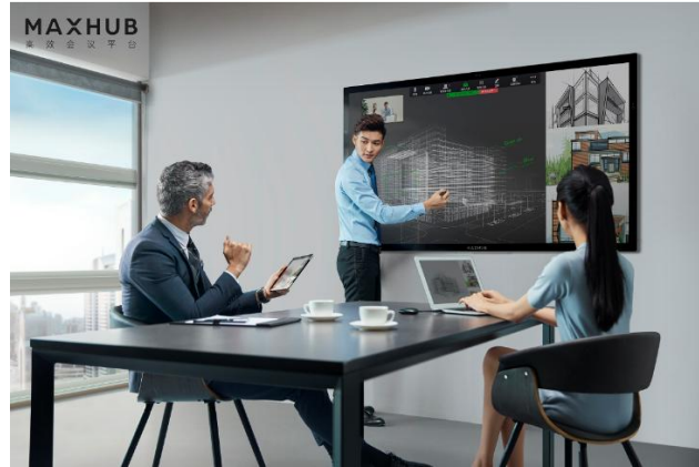
图7：MAXHUB交互智能平板产品